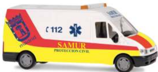
FORD Transit 2000 „Proteccion Civil Samur“ 51062 | 1:87 | ES | PG 19