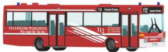
MERCEDES-BENZ O 405 „Feuerwehr Pforzheim“ 71822 | 1:87 | D | PG 45