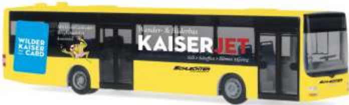
MAN Lion's City „Autobus Schlechter - Kaiser Jet“ 67493 | 1:87 | AT | PG 45