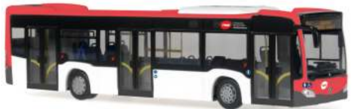
MERCEDES-BENZ Citaro ´12 „Barcelona“ 69444 | 1:87 | ES | PG 45