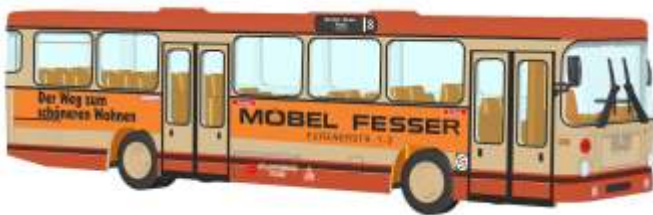
MAN SL 200 „Stadtwerke Trier“ 72310 | 1:87 | D | PG 49