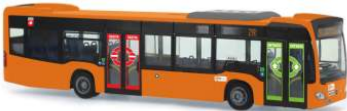
MERCEDES-BENZ Citaro ´12 „CTT - Livorno“ 69445 | 1:87 | IT | PG 45