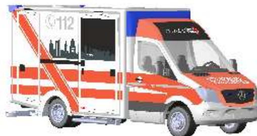
WIETMARSCHER AMBULANZF. Design-RTW 2012 „DRK Leipzig“ 72020 | 1:87 | D | PG 28