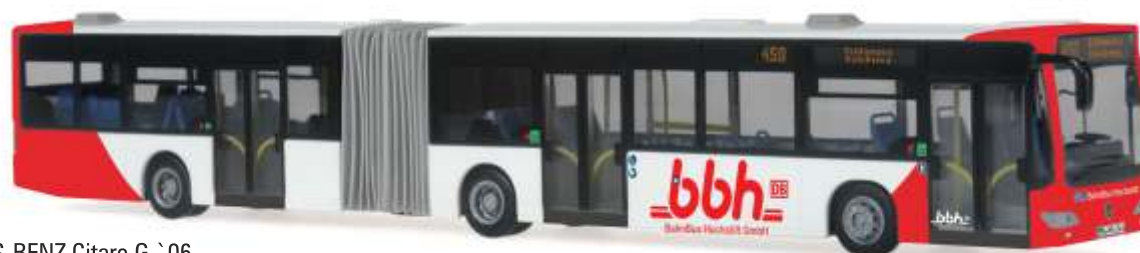
MERCEDES-BENZ Citaro G `06 „BBH - Bahn Bus Hochstift“ 67084 | 1:87 | D | PG 50