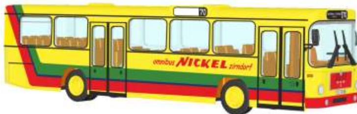
MAN SL 200 „Nickel Reisen, Zirndorf“ 72311 | 1:87 | D | PG 49