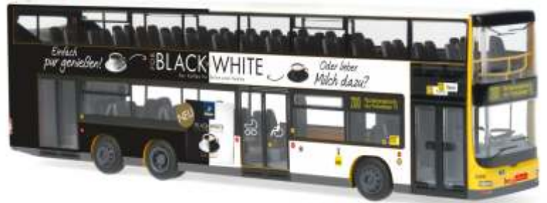
MAN Lion's City DL07 „BVG - Tchibo“ 67771 | 1:87 | D | PG 49