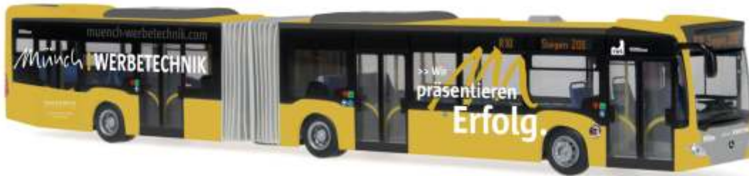
MERCEDES-BENZ Citaro G ´12 „VWS Siegen - Münch Werbetechnik“ 69539 | 1:87 | D | PG 49