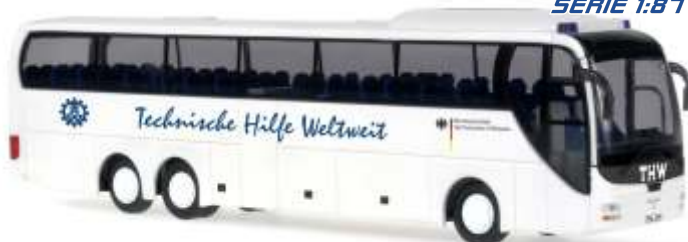
MAN Lion's Coach „THW- Technisches Hilfswerk“ 65540 | 1:87 | D | BOX | PG 43