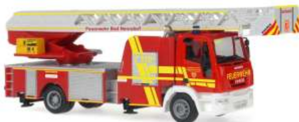
MAGIRUS DLK 32 „Feuerwehr Bad Nenndorf“ 68557 | 1:87 | D | PG 45