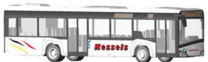
SOLARIS Urbino 12 `14 „Kessels Reisen, Brüggen“ 73002 | 1:87 | D | PG 46