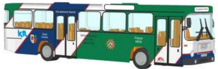
MAN SL 200 „Polizei NRW“ 72306 | 1:87 | D | PG 49