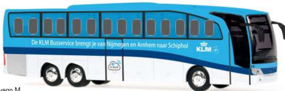
MERCEDES-BENZ Travego M „KLM“ 14123 | 1:43 | NL | PG 59