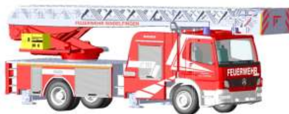
MAGIRUS Atego DLK 32 „Feuerwehr Sindelfingen“ 71612 | 1:87 | D | PG 45