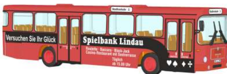
MAN SL 200 „RBA - Spielbank Lindau“ 72312 | 1:87 | D | PG 49