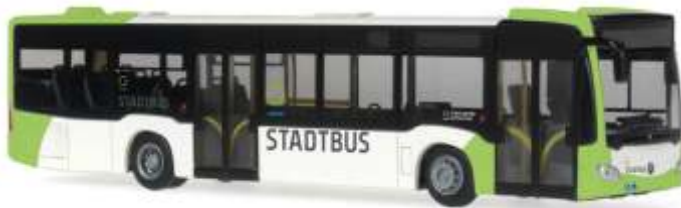
MERCEDES-BENZ Citaro `11 „Stadtwerke Gütersloh“ 68729 | 1:87 | D | PG 45